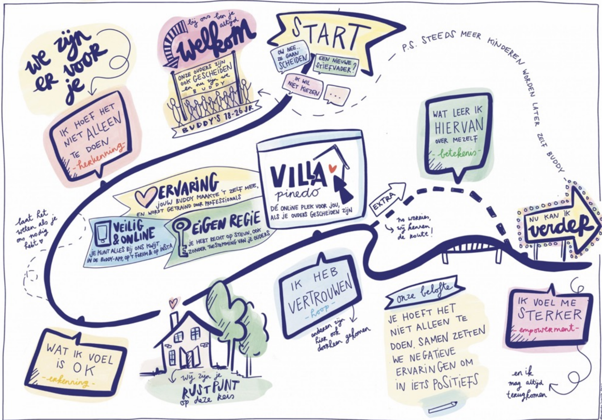
DE ROUTE DIE KINDEREN EN JONGEREN BIJ ONS AFLEGGEN